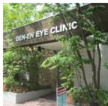
クリニック正面入口